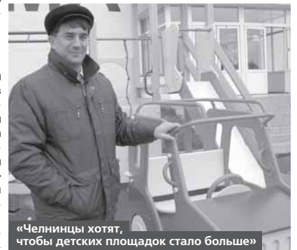
«Челнинцы хотят, чтобы детских площадок стало больше»