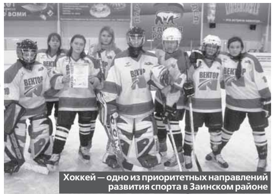
Хоккей — одно из приоритетных направлений развития спорта в Заинском районе

в Заинском муниципальном районе приобщают население к занятиям физкультурой и спортом, воспитывают призеров чемпионатов РТ, России, Европы и мира