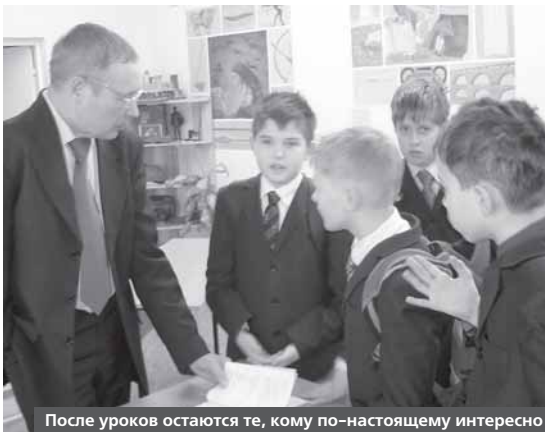
После уроков остаются те, кому по-настоящему интересно