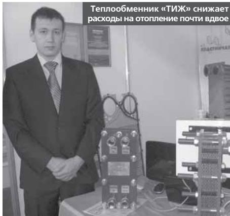
Теплообменник «ТИЖ» снижает расходы на отопление почти вдвое

Юбилейная выставка не осталась незамеченной: за три дня ее работы экспозиции посетили более 3000 посетителей, 80 процентов из которых – специалисты. Организаторами форума стали мэрия и исполнительный комитет города Набережные Челны, Комитет по развитию малого и среднего предпринимательства РТ, бизнес-инкубатор и Торгово-промышленная палата города Набережные Челны и региона «Закамье».