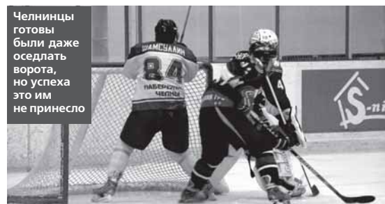
Полосу подготовила Римма МУХАМЕТЗЯНОВА

Несмотря на проигранную серию, челнинская команда осталась в турнирной таблице на третьем месте.