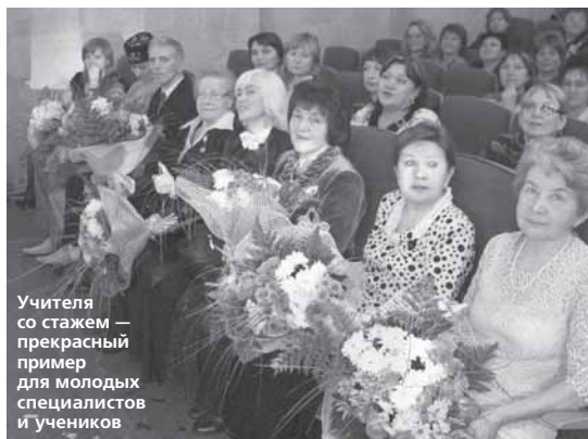
Учителя со стажем – прекрасный пример для молодых специалистов и учеников

В уходящем году особое внимание было уделено людям, которым мы обязаны практически каждым своим современным навыком – от умений читать, считать и пользоваться компьютером до способности размышлять, анализировать, принимать решения.