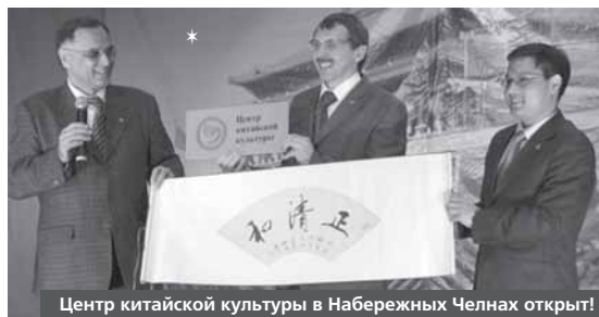
Центр китайской культуры в Набережных Челнах открыт!

— Китайский язык проще изучать, если уже знаешь английский — немного легче дается произношение. Фонетика очень сложная, в ней большую роль играет интонация, ударение, долгие и короткие гласные. Многим кажется, что достаточно просто выучить названия предметов, действий, и мож-