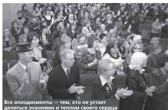
Все аплодисменты – тем, кто не устает делиться знаниями и теплом своего сердца