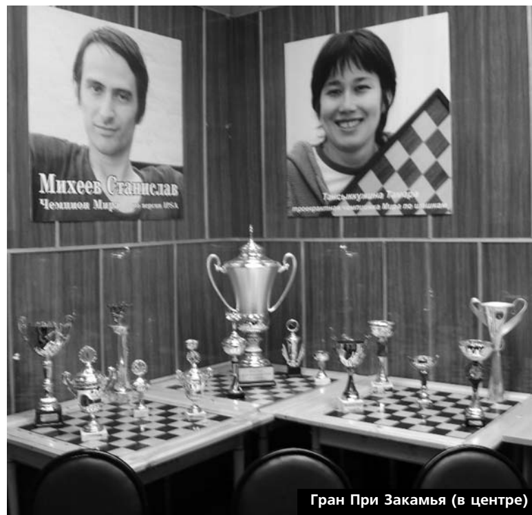
Гран При Закамья (в центре)