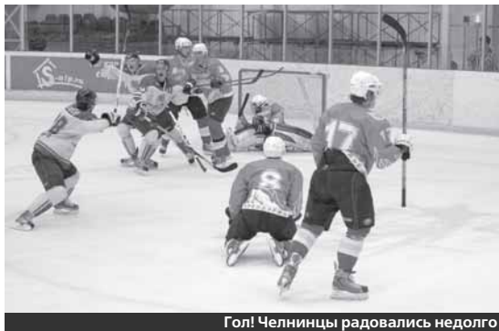
Гол! Челинцы радовались недолго