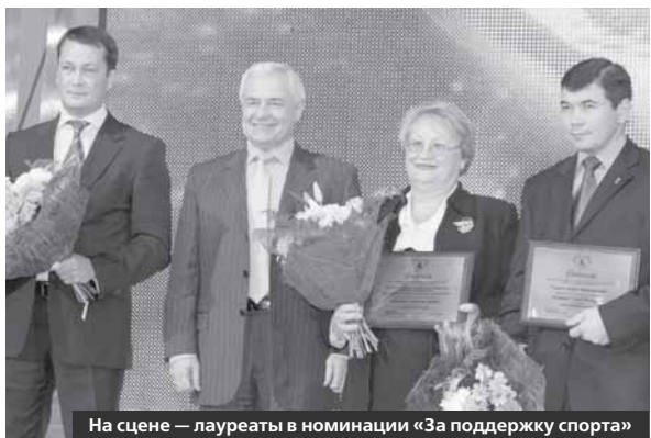
На сцене — лауреаты в номинации «За поддержку спорта»